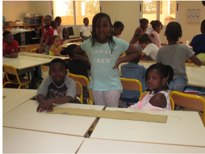
une bande de tissu qui a trempé plusieurs fois dans le galaman est devenue couleur ocre